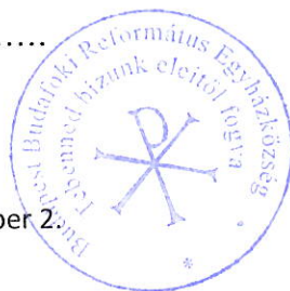
Szász Lajos lelkipásztor